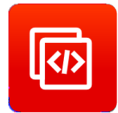
增强型 AT 命令集